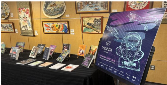
La marque visuelle du 41e Salon du livre de la Côte-Nord a été réalisée par Marine Imprime, une illustratrice des Escoumins.

Par Lucas Sanniti 12:19 PM - 2 avril 2025